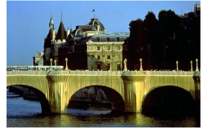
"En 1985, le Pont Neuf est emballé par Christo"

Il a inspiré de nombreux artistes peintres (Callot, Carnavalet, Pissarro), écrivains (Victor Hugo, Anatole France) et cinéastes (les amants du Pont-Neuf de Léo Carax).