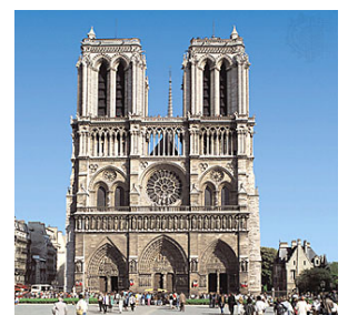
"La cathédrale de Notre Dame longue de 130m large de 48m et haute de 35m domine l'île de la Cité. "